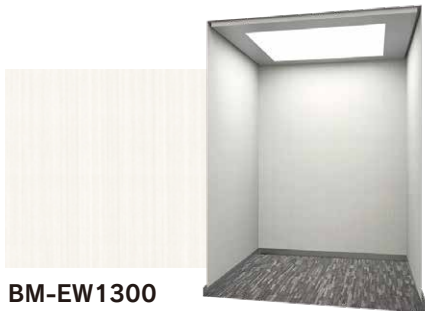
BM-EW1300 ラインウォールナットプラス