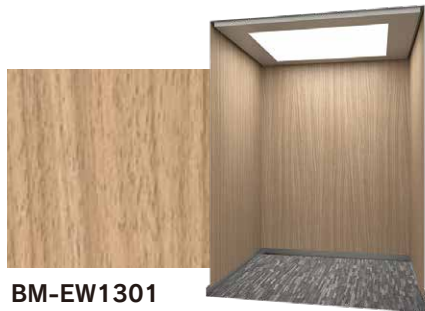
BM-EW1301 ネイキッドイタリアンウォールナット