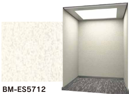
BM-ES5712 シルキーフロスト