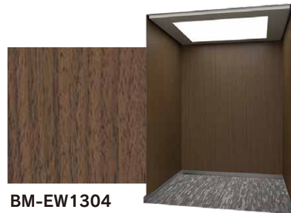
BM-EW1304 エヴルーウォールナット